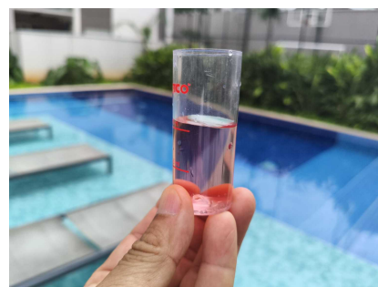
piscina Adulto foi medido a alcalinidade está em 80ppm