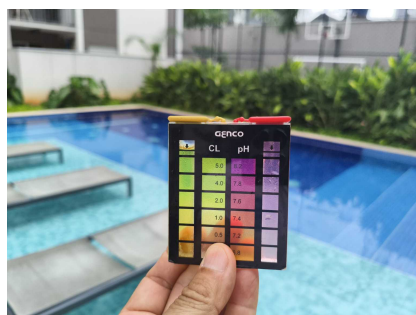
piscina Adulto foi medido os parâmetros químicos cloro livre Ph e alcalinidade