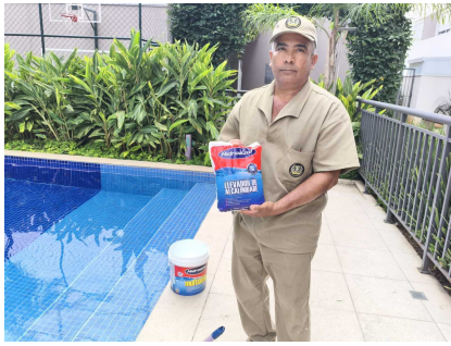
se José acertando a alcalidade da piscina adulto