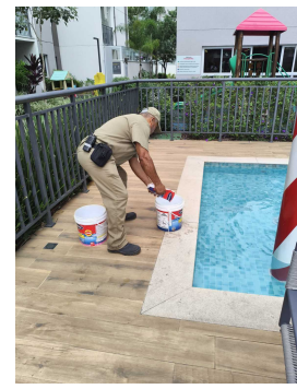
ar José manutenções ajustando a alcalidade da piscina infantil conforme orientações Técnicas