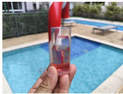
piscina infantil foi medido a alcalinidade está em 60ppm