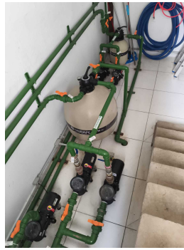
casa de máquinas OK